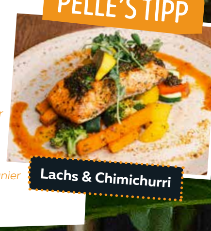
Lachs & Chimichurri

Unsere Hauptgerichte werden mit Pommes frites und einem frischen Salat serviert